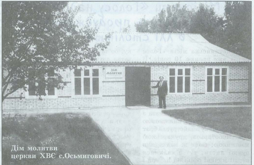
Дім молитви церкви ХВС с.Осьмиговичі.