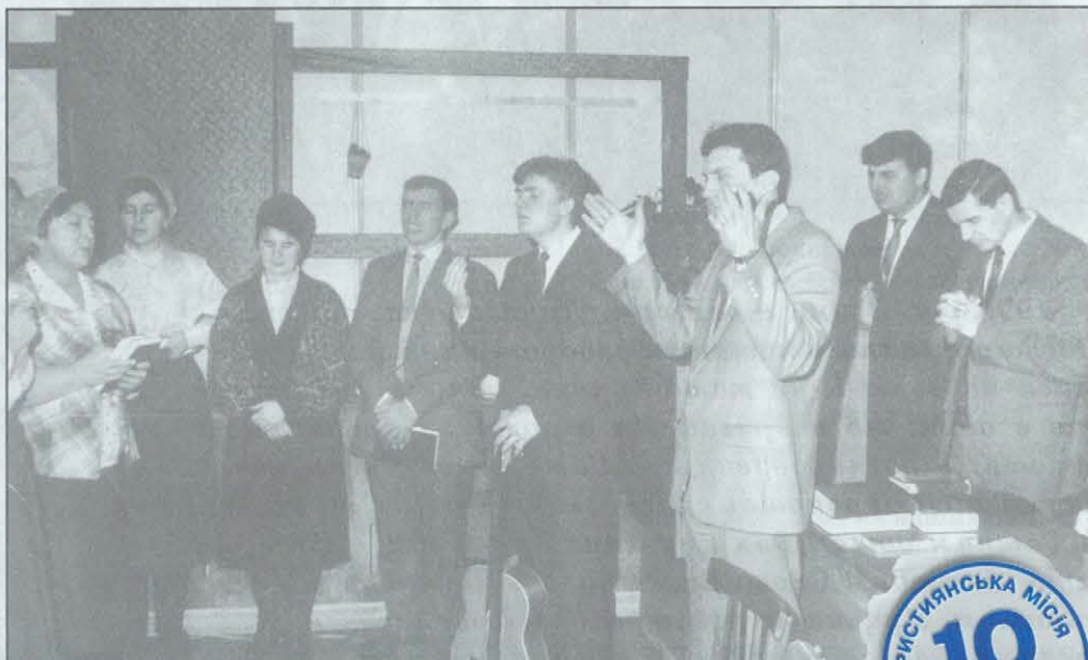
Якутія. Перші зібрання, перші молитви і — перші плоди (фото з архіву, 1990 рік).

...Пригадую перше хрещення в Якутії, в м. Удачному. 22 душі стояли біля невеличкої річечки у